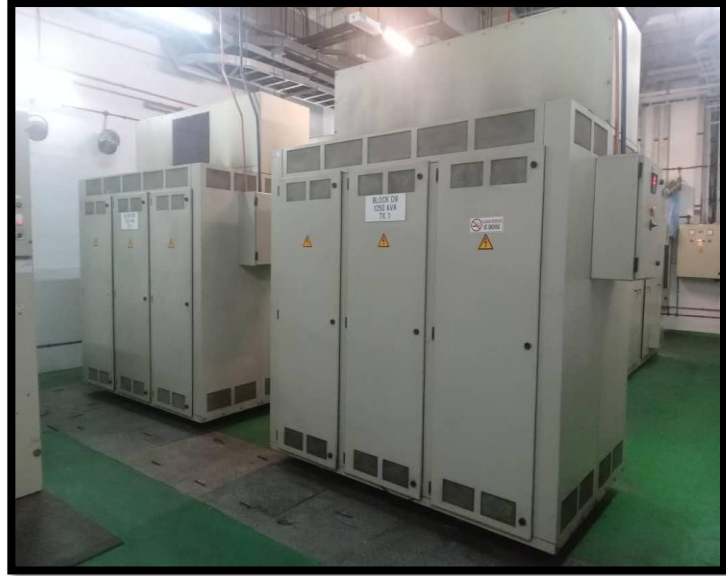
TRANSFORMER DI BLOK SP8