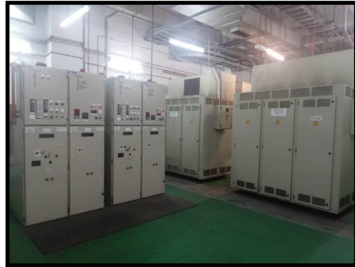
TRANSFORMER DI BLOK SP8